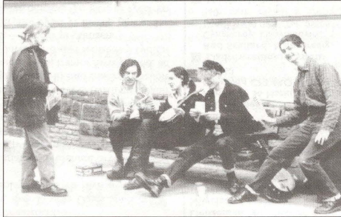
■ Railroad Bill yn derbyn taflenni Trident yn wobwr am ddiwrnod caled o chwarae

A ydyd chi yn yr ysgol neu mewn coleg chweched dosbarth? Mae Ieuenctid CND (fel y fyddin) yn trefnu siaradwyr ysgol ar gyfer sesiynau astudiaethau cyffredinol, ac ati. Yn achos y fyddin, mae hynny i'ch darbwyllo yr hoffech yrru tanc a lladd pobl; yn achos ICND, i siarad am y bygythiad niwclear, posibiliadau diarfogi, a beth y gellwch chi ei wneud. Os hoffech i rywun ddod i annerch eich ysgol neu'ch coleg chi, danfonwch lythyr i'r cyfeiriad isod.